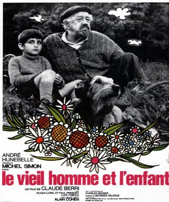
Le vieil homme et l'enfant de C.Berri (1966)