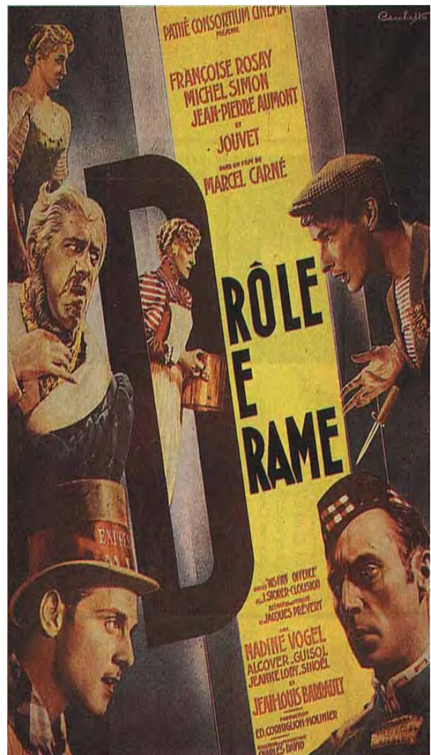
Drôle de drame de M.Carné (1937)