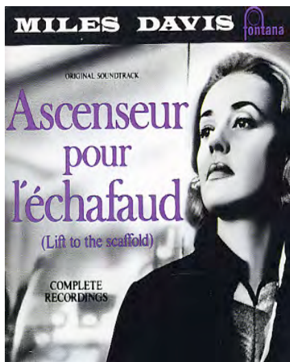
Ascenseur pour l'échafaud . Louis Malle. 1957