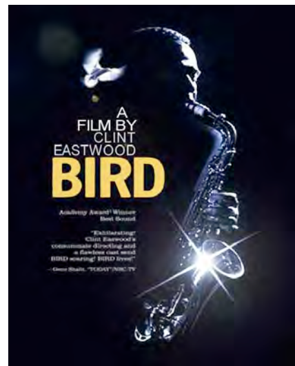
Bird . Clint Eastwood. 1987