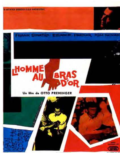
L'homme au bras d'or . Otto Preminger. 1955